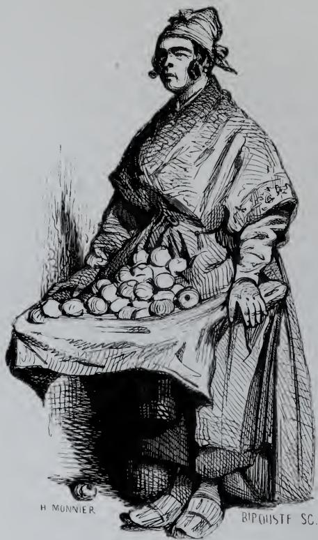
La Marchande des Quatre Saisons.